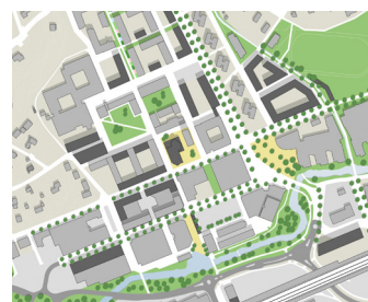
Förutsättningar - ex platsutformning