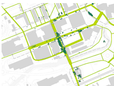
Användningen - gångflöden och vistelse