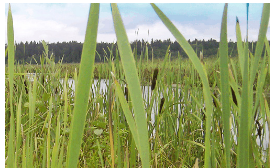
Västra Järvafältets naturreservat