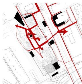
Prognos av gångflöden under ombyggnadsetapp