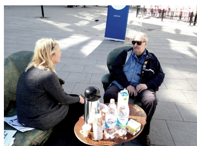
Bergshamrasalongen – dialog på Bergshamra torg