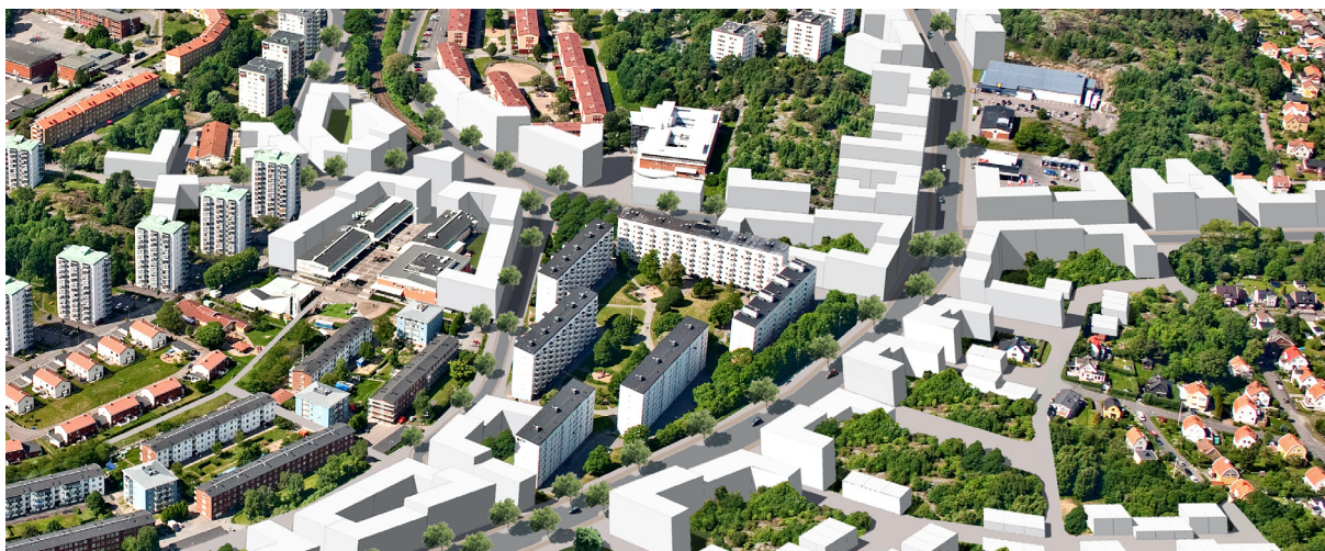
Stadskvalitetsscenario för Biskopstaden.