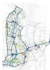
Förtättningsbara ytor och viktiga stråk