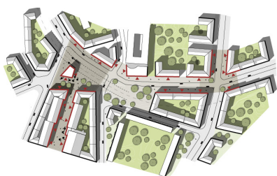
Vårväderstorget i stadskvalitetsscenario