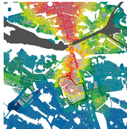
Stadsdelen blir tät som delar av innerstaden