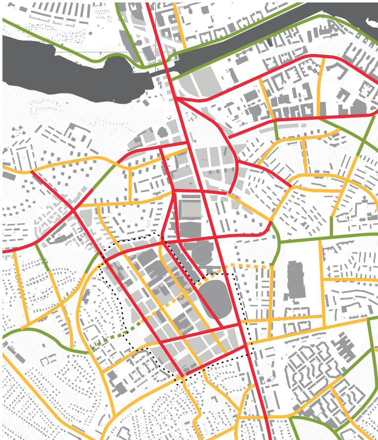
Sammanfattande bild av stadsdelsövergripande stråk i den framtida Söderstaden