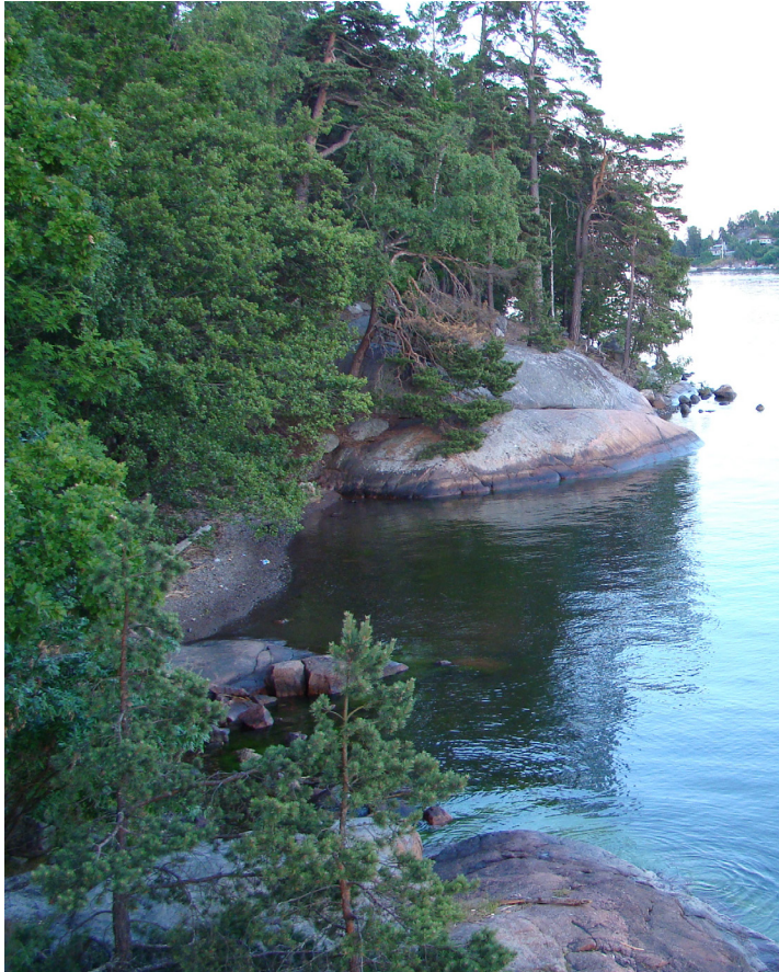
Grön oas Lidingö