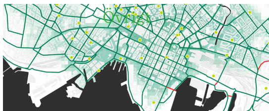
Förslag på ett tätare tillgängligare och mer direkt huvudcykelnät