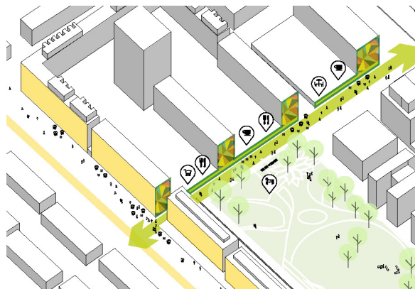
Principskiss för utveckling av Tusbystråket i Tureberg (Malmvägen)