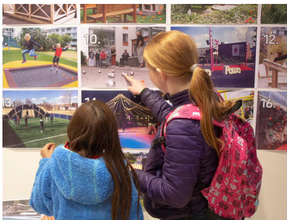
Referensbilder för framtida offentliga rum diskuteras på ett Öppet hus i Edsberg