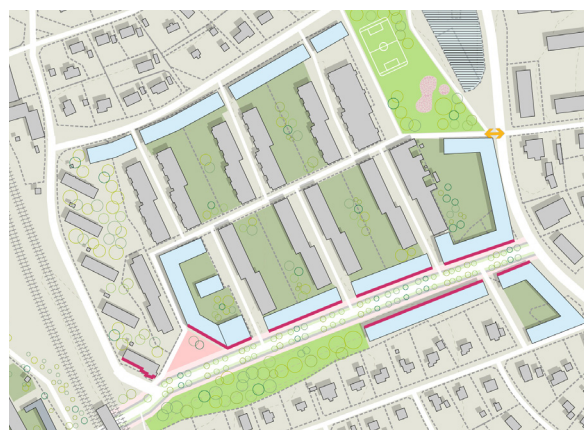
Strukturplan för Helenelund