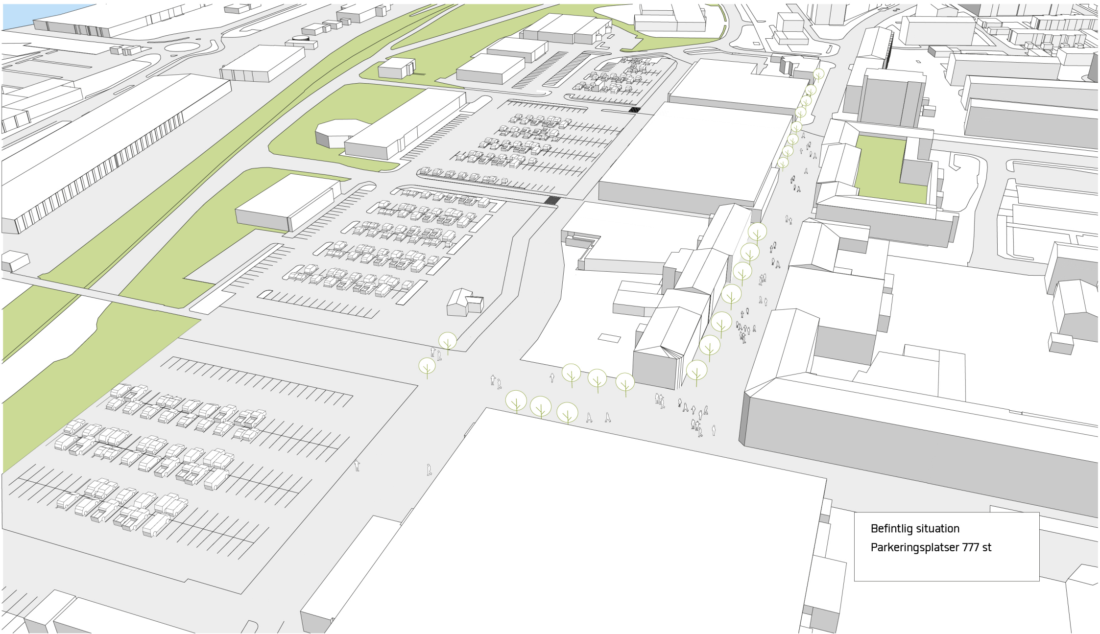
Befintlig situation Parkeringsplatser 777 st