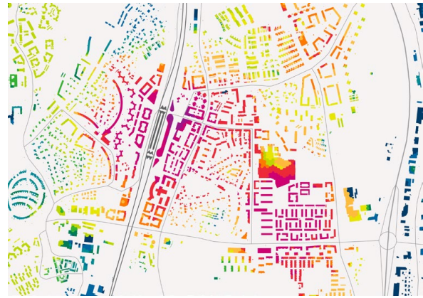
Täthet av boende och arbetande i Väsbys stationsområde 2040