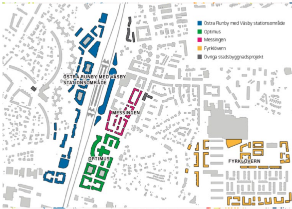
Pågående planering i Väsbys stationsområde till år 2040