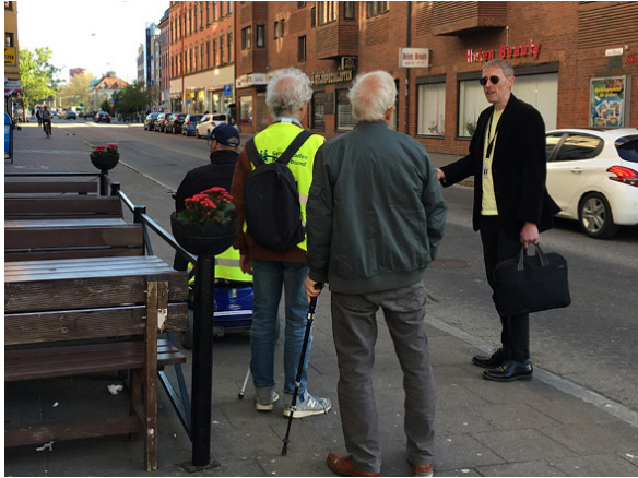
Gåtur med fokus på funktionsvarierades behov