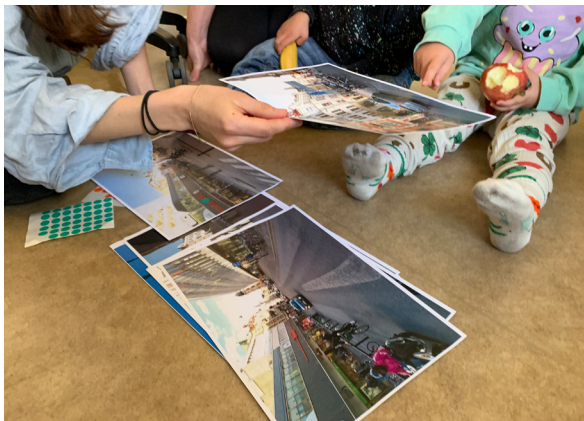
Fokusgrupp med yngre barn om Södra Förstadsgatan